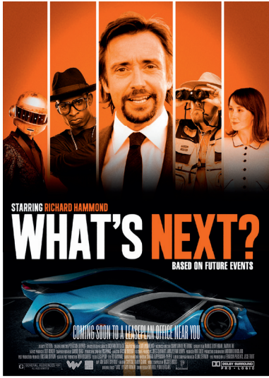
Film premiere medewerkers