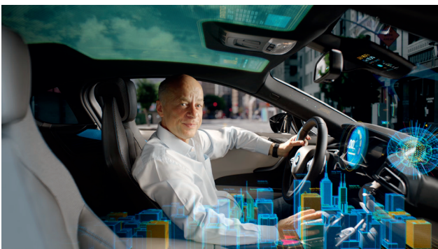
Video speech CEO voor medewerkers