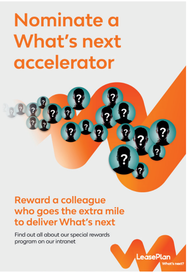
Accelerator programma voor medewerkers